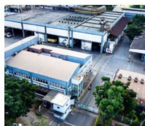
UNIDADE DE PIRAPORA Estr. dos Romeiros, 49 - Guarapiranga, Pirapora do Bom Jesus, SP 06550-000