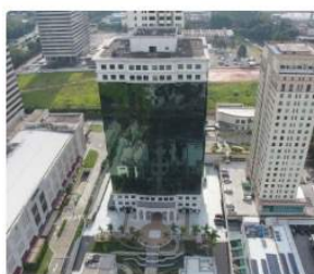
ESCRITÓRIO CORPORATIVO Alameda Rio Negro • Alphaville Industrial. Salas 501 e 504. Barueri, SP 06454000